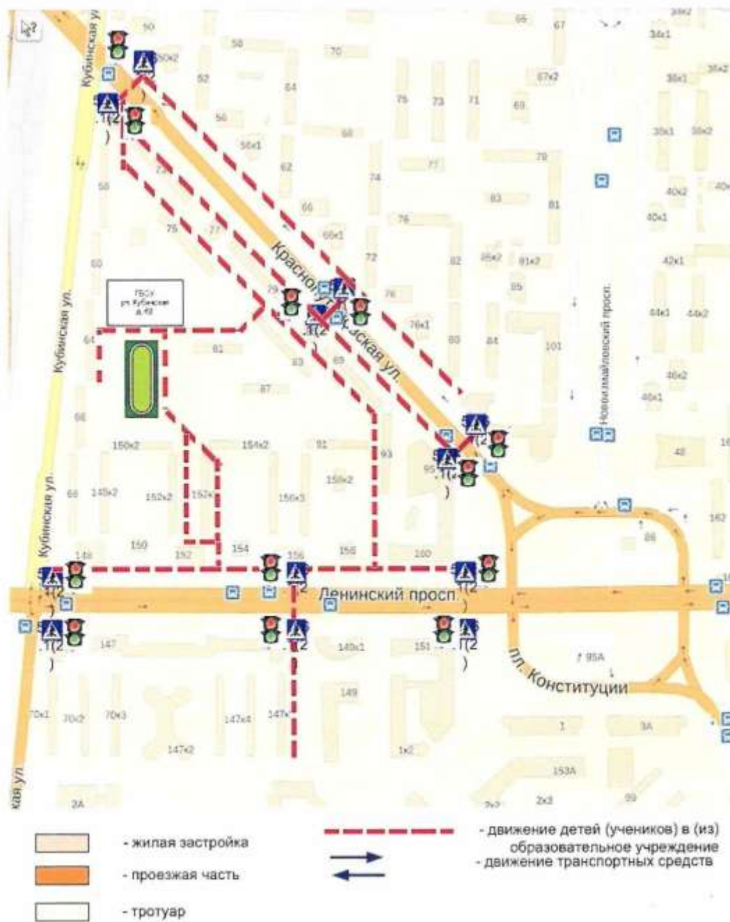
Маршруты движения организованных групп детей от ОУ