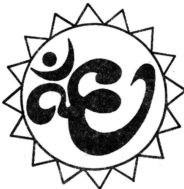
Рисунок для фиксации глаз

Вариант 3. Вокруг знака проведена окружность. Перемещайте свой взгляд по окружности, двигая одновременно глаза и голову. Делайте упражнение вначале с открытыми глазами, затем с закрытыми, представляя окружность.